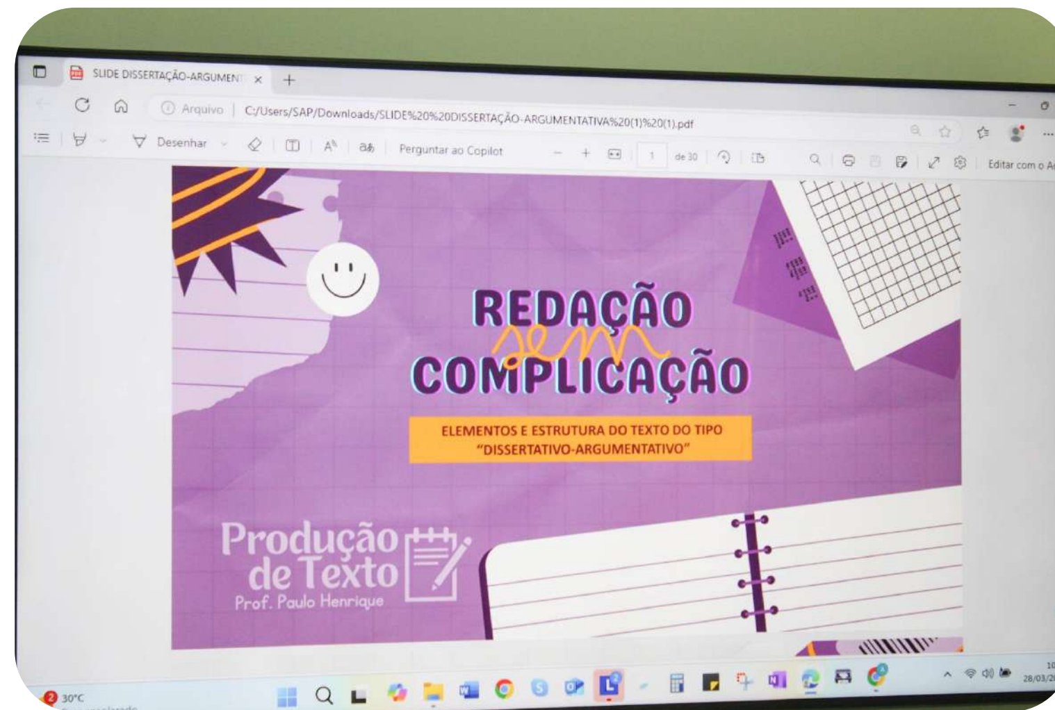
Aula cursinho preparatório