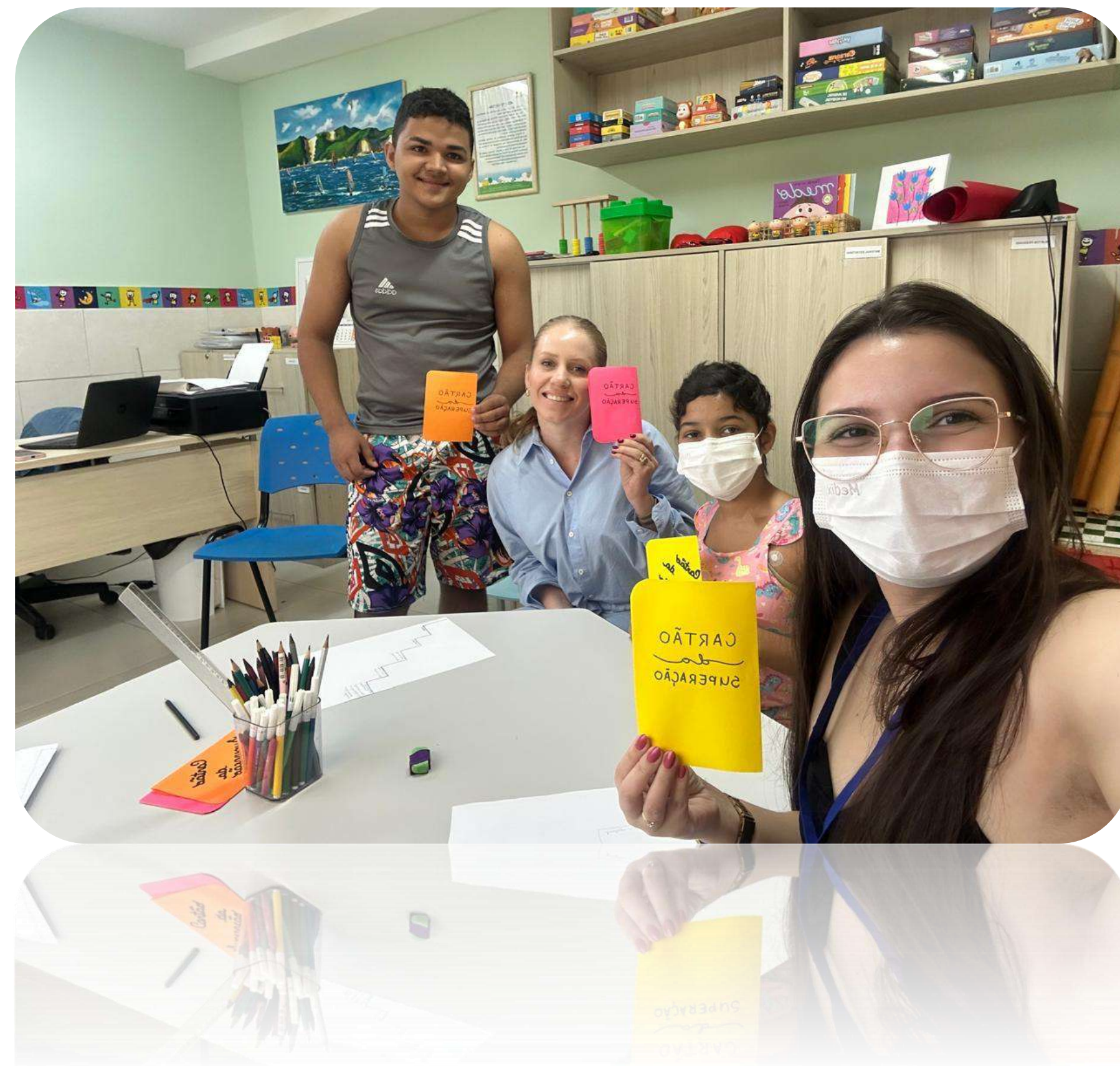
Grupo de Adolescentes