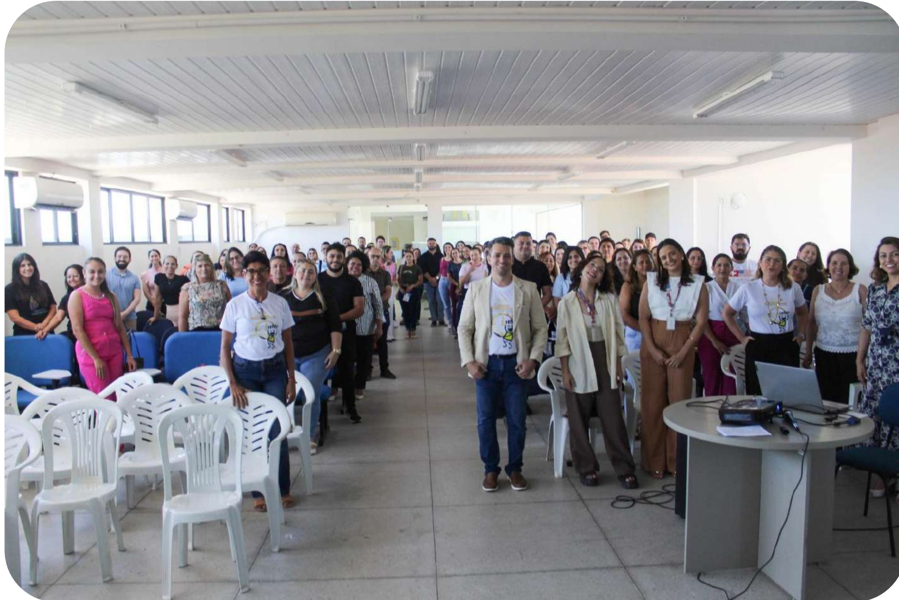
XX Fórum do Diagnóstico Precoce Câncer Infantojuvenil em Pau dos Ferros