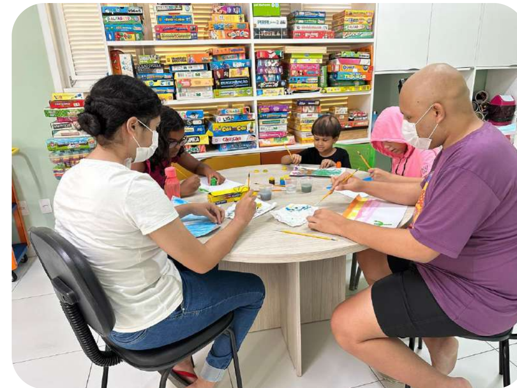
Grupo de Adolescentes