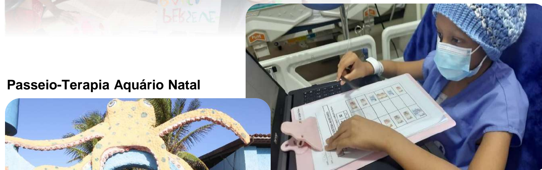
Passeio-Terapia Aquário Natal