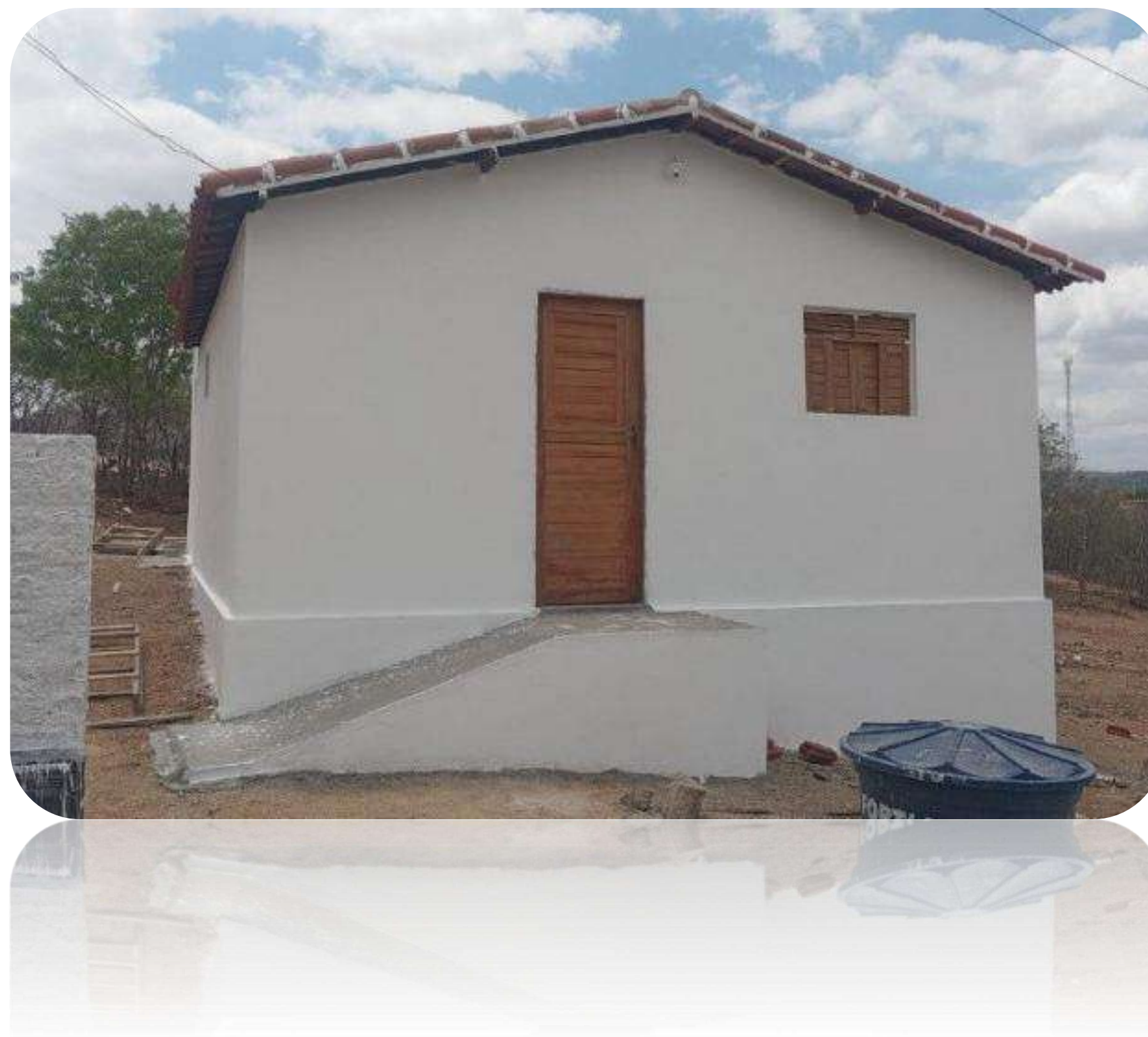
Casa construída em Caicó/RN – Projeto Vida

O Projeto Vida, desenvolvido pela Casa Durval Paiva desde 1998, tem por objetivo promover qualidade de vida e o resgate da cidadania de crianças e adolescentes com câncer e doenças hematológicas crônicas e suas famílias, por meio da melhoria e garantia de uma habitação segura e saudável. Em 2025, o Projeto Vida teve financiamento da Teleperformance e do Supermercado Nordestão (Troco Solidário), totalizando R$ 181.076,55 captados, acrescidos de R$ 21.945,00 de aporte próprio da Casa Durval Paiva. Com essas parcerias, foi possível construir 03 casas e realizar 04 reformas, beneficiando diretamente 28 pessoas. As 356 visitas domiciliares realizadas em 82 municípios do RN possibilitaram, ainda, a entrega de 209 cestas básicas, alcançando indiretamente cerca de 1.400 pessoas.