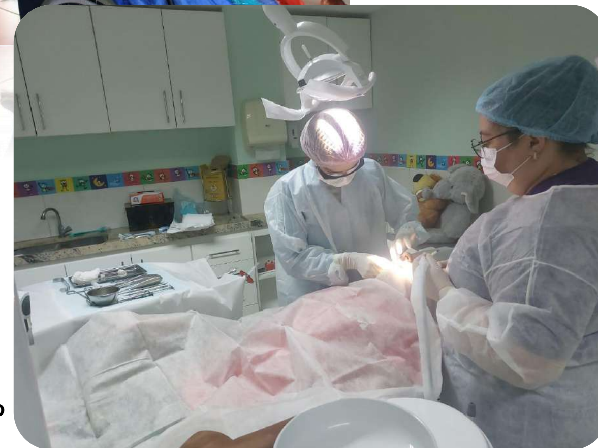
Residente em atuação