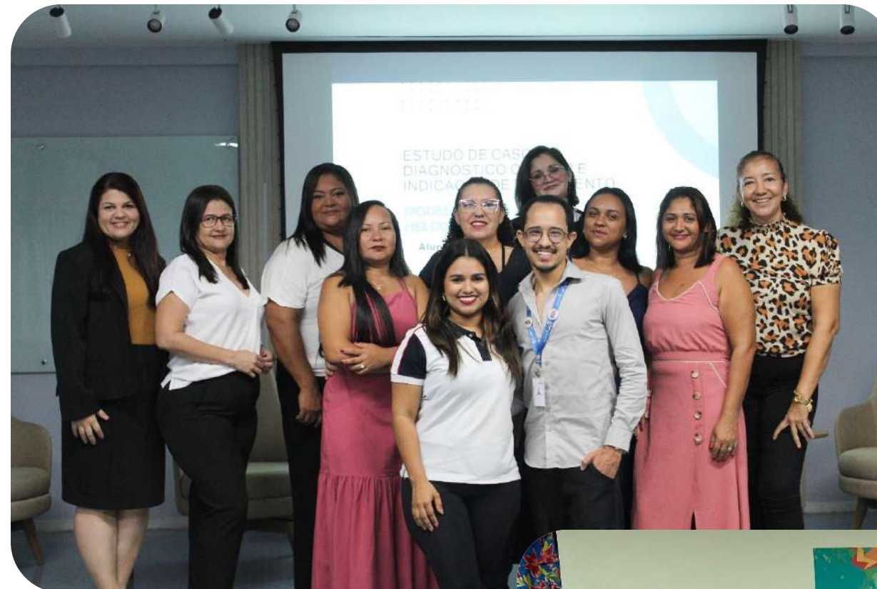
Conclusão Curso de Cabeleireiro