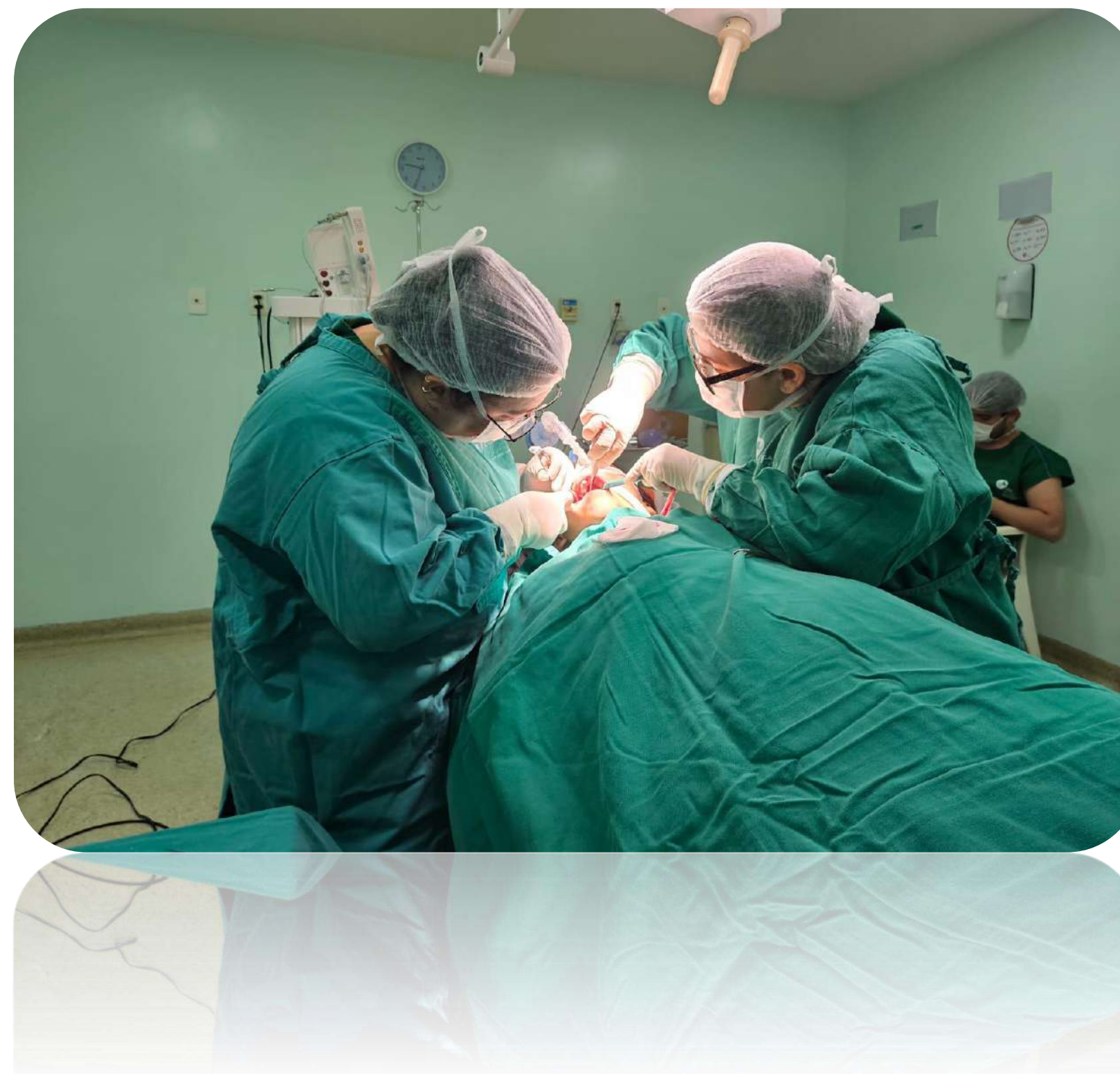
Atendimento em Centro Cirúrgico