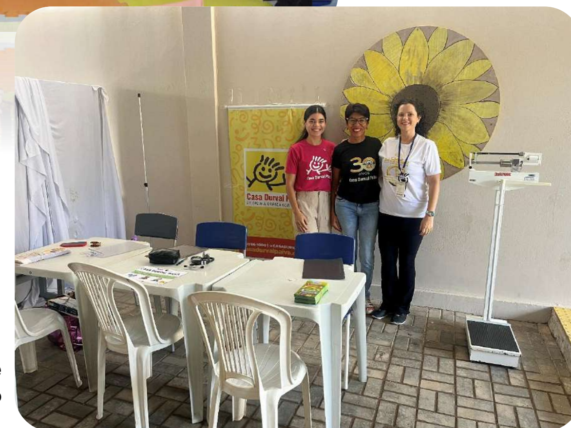
Ação Prefeitura e Você – Planalto