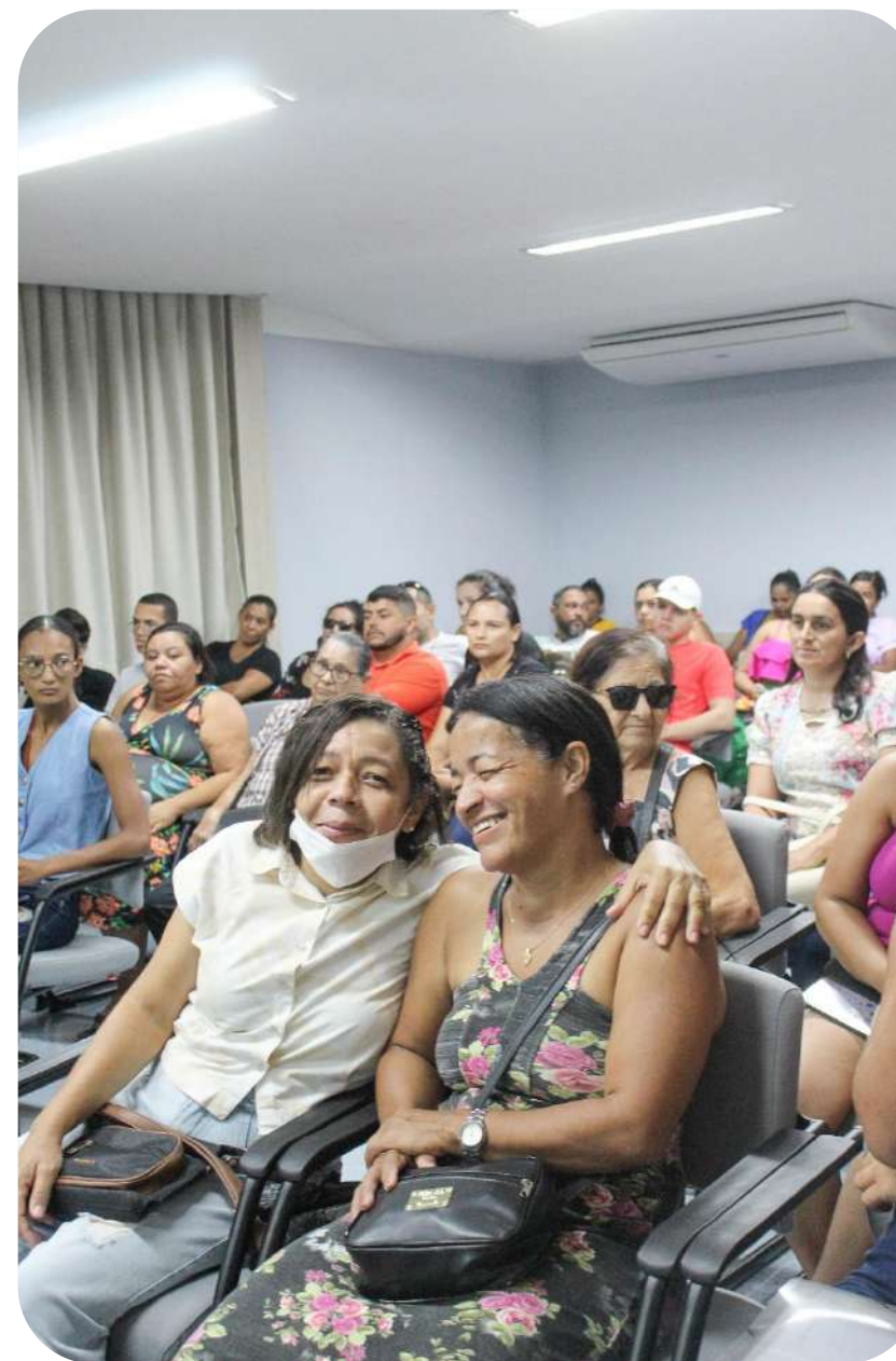
Reunião de Fortalecimento de Vínculos - Dezembro